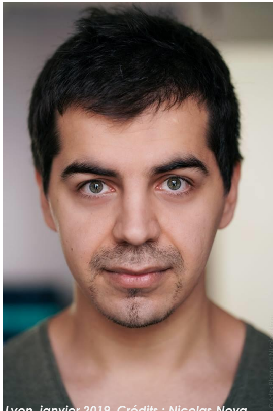
Lyon, janvier 2018

C'est à nous de connaître ses codes et de s'adapter à elle, pas le contraire. Ceci n'est pas une leçon. Le spectacle est avant tout une histoire et le public peut en tirer le message qu'il veut. Je le laisse libre.